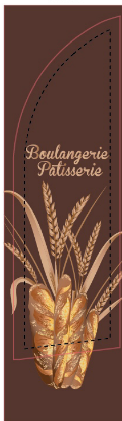
Gabarit + Maquette client