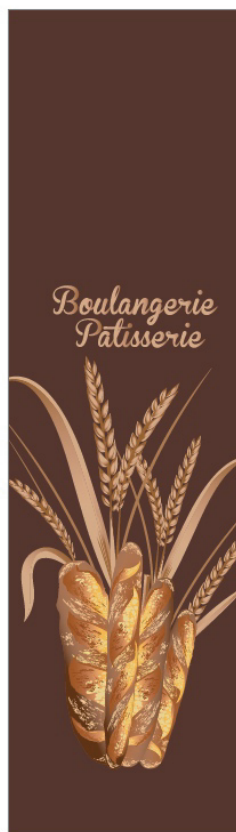
Maquette « nettoyée ».